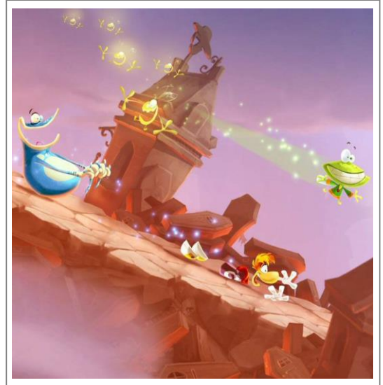
Szene aus Rayman Legends.

Wir blicken hinter die Kulissen der Spieleindustrie und beleuchten die verschiedenen Schritte der Entwicklung eines Computerspiels. Wir werden sehen, dass die verschiedensten Disziplinen zusammenarbeiten müssen um ein modernes Spiel zu entwickeln.